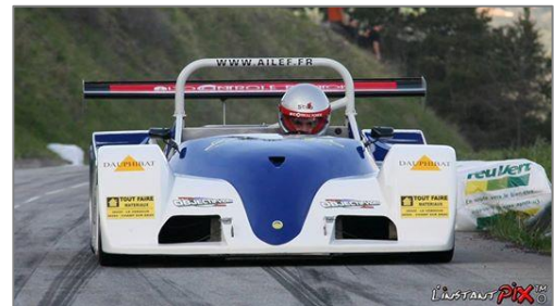
DIMANCHE 4 MAI