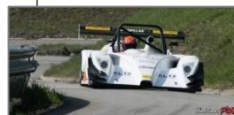
36EME COURSE DE COTE

Nous invitons les assistantes maternelles ainsi que les parents dont les enfants ont pu profiter de la garderie sans oublier les voisins, le personnel de l'école ainsi que les élus de la communauté de communes du Trièves.